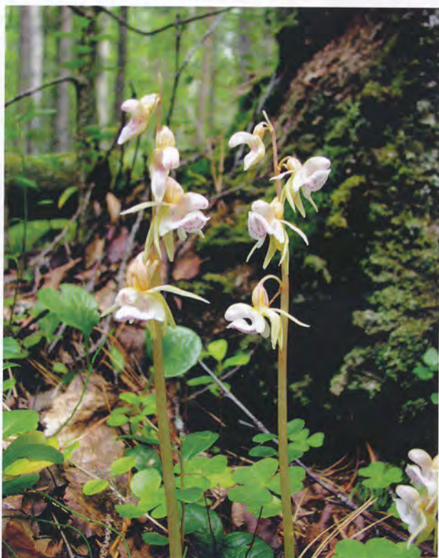
• Орхидея надбородник безлистный