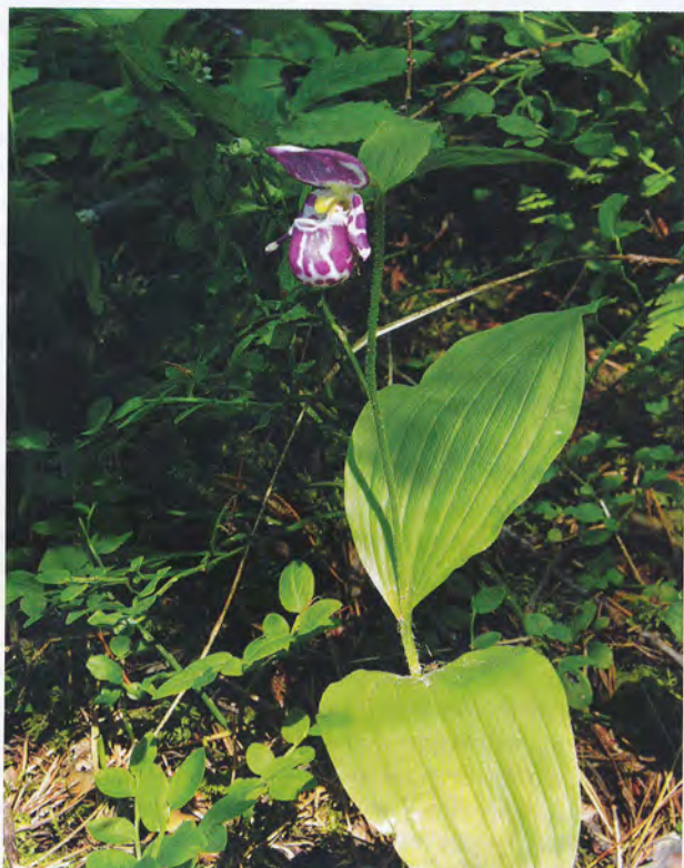
• Орхидея башмачок капельный