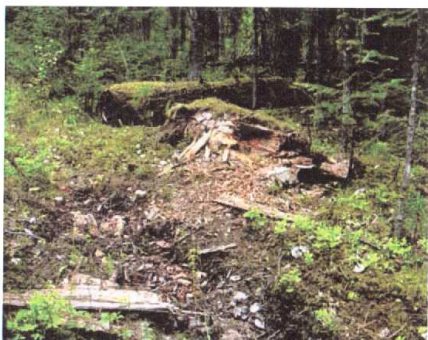
Рисунок 4. Медведь добрался до гнезда полевки