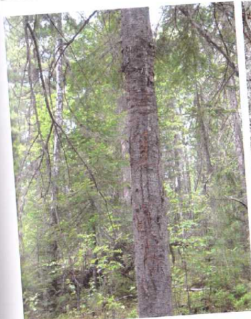
Рисунок 1. Маркерное дерево

В связи с небольшой численностью работников научного отдела в Юганском заповеднике проводится не единовременный (сразу на нескольких участках), а постоянный (долговременный) учет на учетных площадях в течение всего периода бодрствования бурого медведя. Учитывая повышенную опасность зверя, необходимо тщательно соблюдать технику безопасности и быть соответственно экипированным. Желательна подстраховка с помощью опытной послушной лайки, знакомой с медведем, которая предупредит человека о приближении к зверю на опасную дистанцию или отвлечет медведя на себя при нападении. Не помешает и наличие личного оружия и отпугивающих средств, например, фальшвеера, ручной сирены и газового баллончика с перцовым газом.