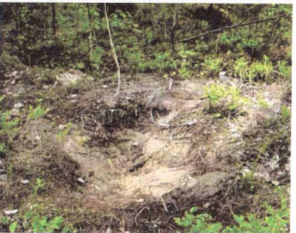
Рисунок 6. Следовая ловушка

Учет начинается со сходом снежного покрова, как правило, в конце мая. В нашем регионе в это время у медведей идет гон, что обуславливает их повышенную следовую и маркерную активность. Отрабатываются постоянные учетные полигоны – в бассейнах рек Негусьях и Вуяяны. Протяженность учетов в одном районе не превышает 10-12 дней. Обычно за это время можно успеть составить полную картину численности и размещения медведей в границах учетной площади, которая составляет около 100 кв.км. Вся площадка покрывается учетными маршрутами по лесостроительным визирам, которые ограничивают кварталы размером 2 × 1 км. Дополнительно закладываются маршруты вдоль рек, крупных ручьев, протекающих в пределах площади учета.