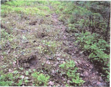
Рисунок 5. Следовая дорожка медведя