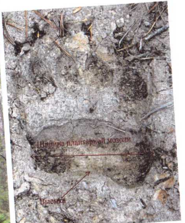
Рисунок 2. След медведя-самца