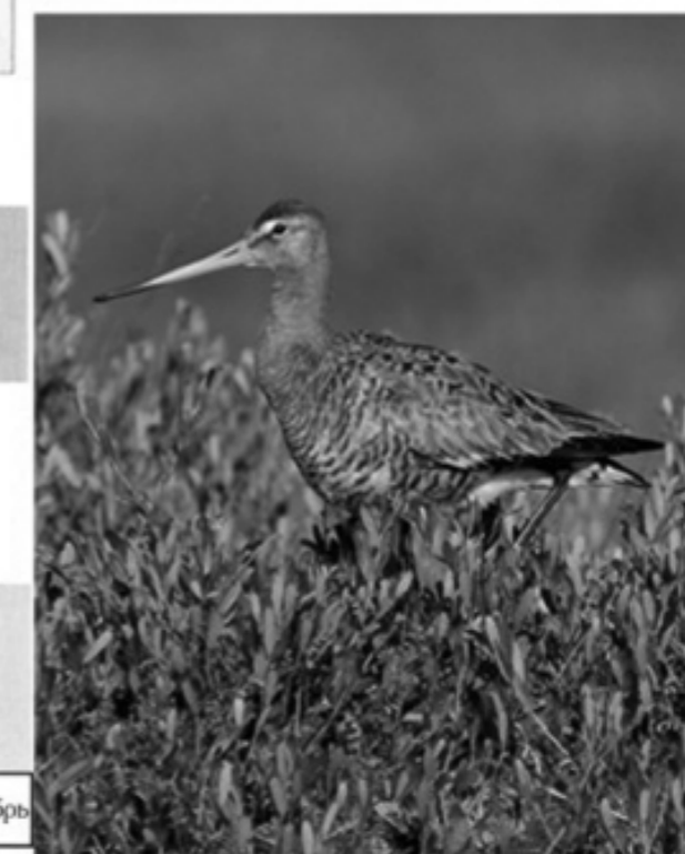
Рис 1. Схема накопления биомассы на болотах Западной Сибири и в связи с годовым циклом большого веретенника.