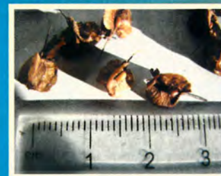
• Плоды конского щавеля

Щавель кислый — двудомное многолетнее травянистое растение с прямостоячим, бороздчатым стеблем, высотой до 100 см. Прикорневые листья продолговатые, у основания стреловидные. Цветки невзрачные, розовые, красные или желтоватые, собраны в метелку, распускаются в июне-июле со второго года жизни. Плоды — коричневые или кирпичного цвета орешки, созревают в июле-августе. Произрастает на лугах, травянистых болотах, влажных опушках леса, по берегам водоёмов. Кроме кислого, в заповеднике встречается ещё 6 видов щавеля: конский, водный, длиннолистный, русский, пирамидальный и щавелёк обыкновенный.