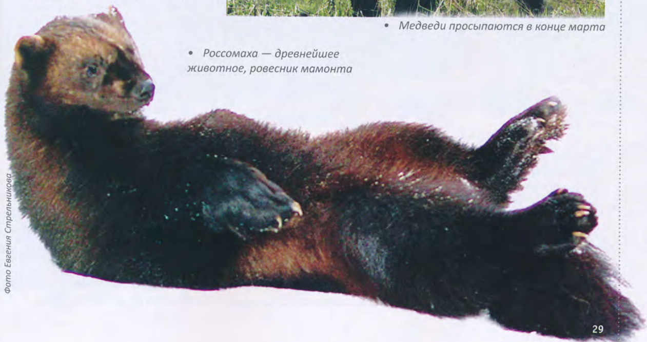
• Росомаха — древнейшее животное, ровесник мамонта