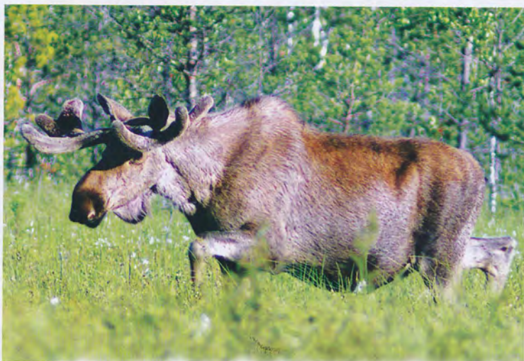
• Лось — самый крупный представитель семейства оленевых

Бурый медведь просыпается в конце марта, когда в лесу еще лежит снег. После выхода из берлоги медведи кормятся молодыми побегами трав, поедают оживающих муравьев, разыскивают вытаявшую падаль. С мая на освободившихся от снега болотах и гривах едят перезимовавшую клюкву, бруснику. До 90% рациона медведя составляет растительная пища.