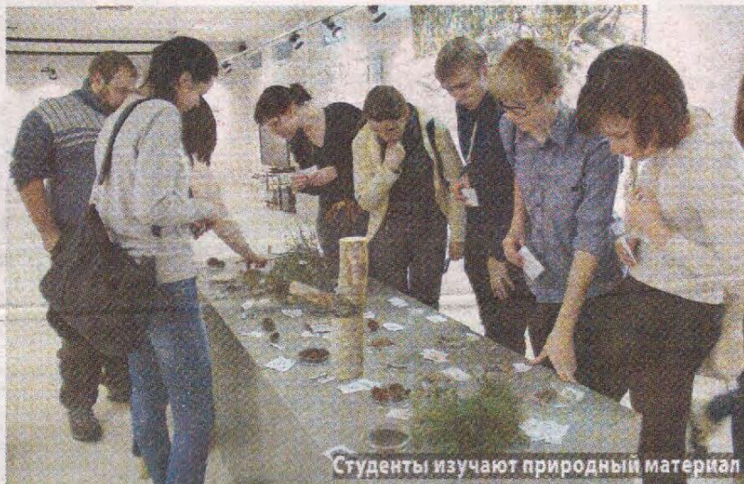
Студенты изучают природный материал

Соболь – хищник, но половину его рациона составляют кедровые орешки. Он ест и ягоды. Лиса – хищник, ее ассоциируют с зайцем, но обычно она питается мышевидными грызунами. Охотится лиса одна. Соболь спит в дупле, лиса на снегу, укрывшись пу-